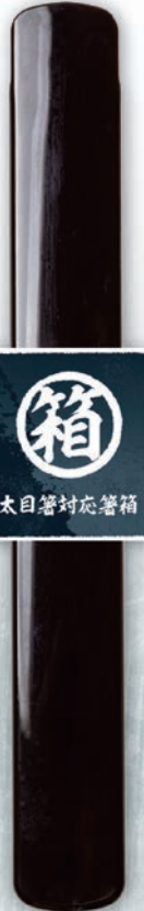
307181 箸箱 大関 ¥630 23.5cm以下用